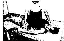
伸ばしてひねる(パート ナーストレッチ)