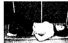
背中を平らにする運動 (手の甲を押しすように おなかに力を入れる)