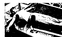
温める、ほぐす、牽引ス トレッチ(D-LAX)