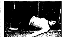
シッポを巻く運動 (お尻に力を入れてシッポ を押し込む)