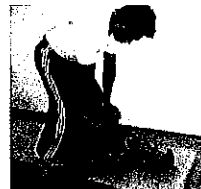
上下に伸ばす(パート ナーストレッチ)