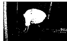
腰部を上下に伸ばす。