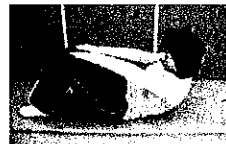
腹筋、へそをのぞきこむ運動